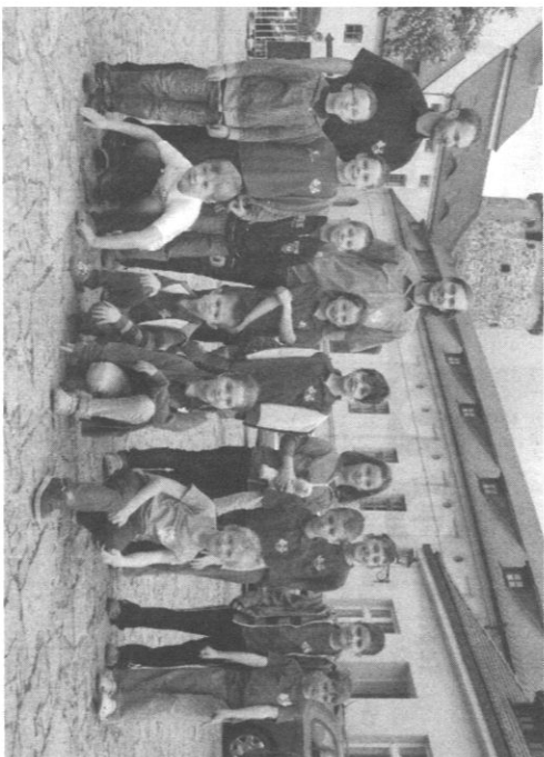
MLADÍ šachisté z Beskydské šachové školy Frydák-Místek.