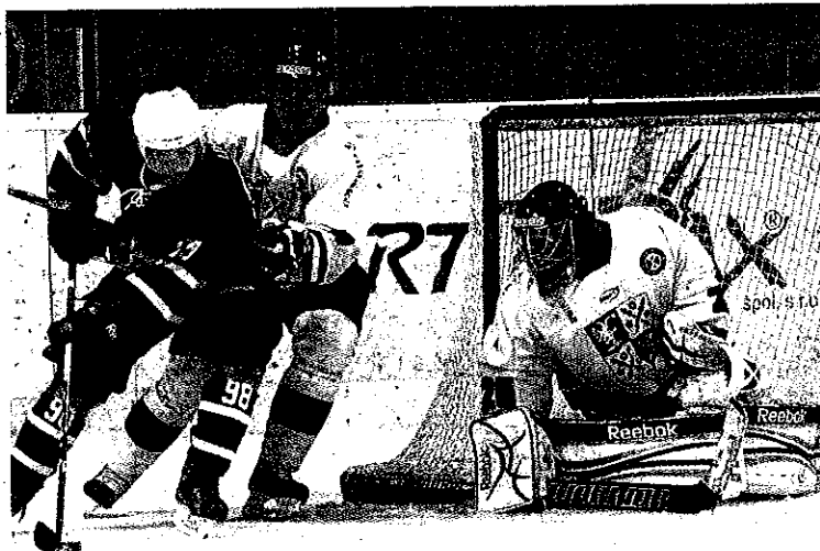
HOKEJISTÉ Frýdku-Místku se připravují na start nové druholigové sezony.