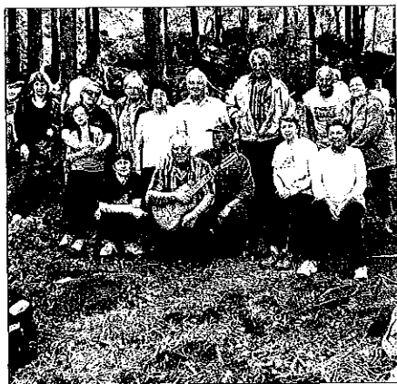
Zpívání s kytarou

5. května zdolalo za hezkého počasí na pět set účastníků 600 m vysokou horu Bradlo ležící v předhůří Jeseníků. To sice není nic mimořádného až na to, že v rámci pochodu byl díky organizátorům z ČSSD v cíli připraven zajímavý program. Na vrcholu hory si mnohí zasoutěžili děti i dospělí, zároveň si také opéct kabanos. Vrcholem celé akce bylo zpívání s kytarou senátora Korytáře, které se konalo letos již po čtrnácté.