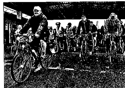
Otevření nové cyklotrasy

Asi pět set cyklistů slavnostně otevřelo novou padesátikilometrovou cyklotrasu podél Olše, která spojuje Karvinsko s polským příhraničím. Cyklisté se tak nově dostanou z Chotěbuze přes Karvinou až do Bohumína, odkud stezka vede až do polské Ratiboře. Peloton v čele se senátorem a starostou Bohumína Petrem Víchou a dalšími zástupci měst, obcí i kraje odstartoval z karvinského Masarykova náměstí a vydal se po cyklotrase přes Bohumín až do polského Tworkowa. Protože je cyklistika v Bohumíně velmi oblíbená, má stejně jako řada dalších volnočasových aktivit podporu zdejší radnice.