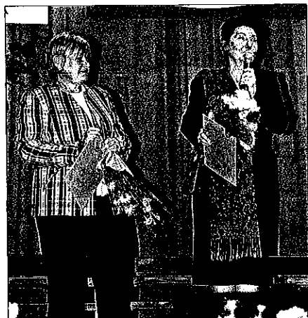
Mezinárodní festival pěveckých sborů

Senátorka Eva Richtrová se v dubnu zúčastnila 33. ročníku mezinárodního Turnaje šachových nadějí, který ve Frýdku-Místku pořádala Beskydská šachová škola. Zúčastnilo se ho 294 šachistů z 12 států čtyř kontinentů. „Šachy rozvíjejí logické myšlení a přispívají k soustředění, což následně vede k snadnějšímu studiu, proto také tuto hru podporuji a obdivuji,“ řekla senátorka Eva Richtrová. Ta v květnu převzala záštitu mimo jiné i nad Mezinárodním festivalem pěveckých sborů Baška 2012. Prezentovalo