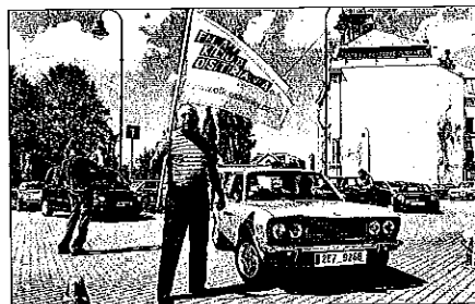
Mezinárodní setkání italských automobilů v Ostravě

5. května se před slezskoostravskou radnicí konalo Mezinárodní setkání italských automobilů, které u příležitosti 54. výročí svého založení uspořádal FIAT klub Ostrava. Posádky vozů nejen z České republiky, ale také z Polska, Slovenska a Maďarska před radnicí přivítal senátor a starosta Slezské Ostravy Antonín Maštaliř. Poté všechny přítomné pozval na prohlídku vybraných prostor historické části radnice a především pak na věž se zvonkohrou, ze které je krásný výhled na celou Ostravu. Na závěr se senátor Maštaliř osobně ujal odměnění startu výletní jízdy Moravskoslezským krajem.