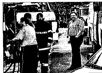
Požár na Hodonínsku

Přímo na místo rozsáhlého lesního požáru na Hodonínsku se 25. května přijel podívat místopředseda Senátu Zdeněk Škromach. Informoval se o aktuální situaci a ocenil nasazení všech zúčastněných. Situace nebyla jednoduchá, požár lesa mezi Bzencem, Vracovem, Ratíškovicemi a Rohatcem komplikoval silný vítr, složitý terén a sucho. S plameny bojovalo na 1 500 hasičů z více než 200 jednotek z České republiky i ze Slovenska. Zachváčeno bylo 200 hektarů lesa, jednalo se o největší lesní požár v naší republice za posledních 15 let.